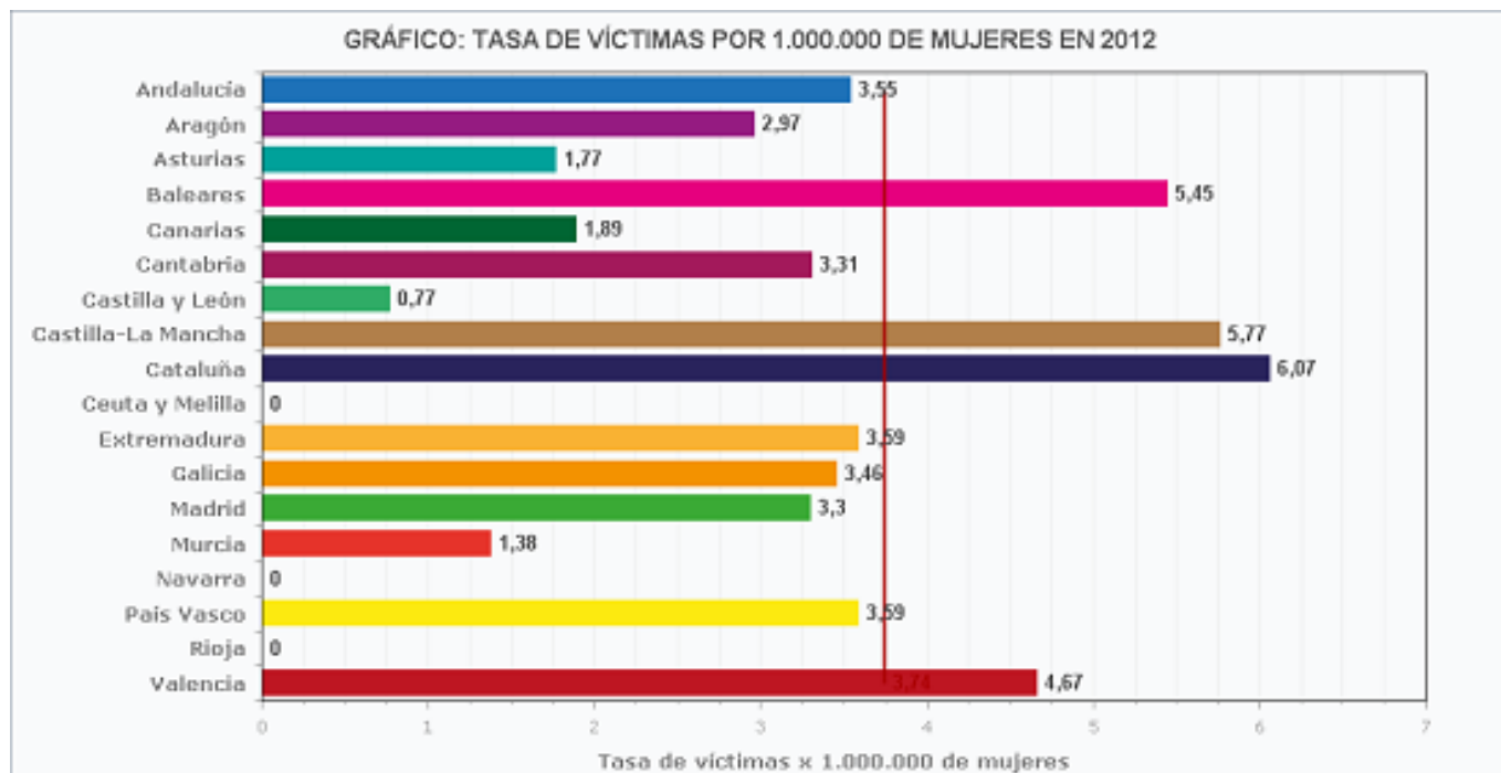
GRÁFICO: TASA DE VÍCTIMAS POR 1.000.000 DE MUJERES EN 2012

■ 0,01 - 2,03 ■ 2,04 - 4,06 ■ 4,07 - 6,07