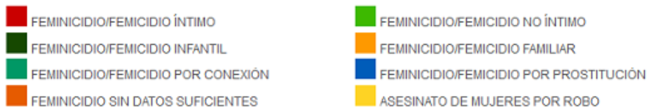
GRÁFICO: TIPOS DE FEMINICIDIO EN 2012 Total:89